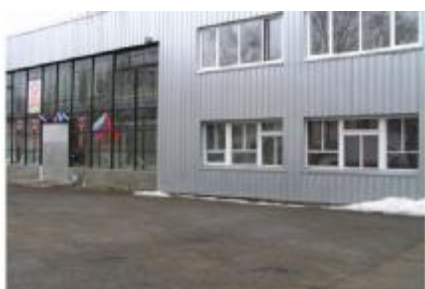
Краеведческий музей и библиотека