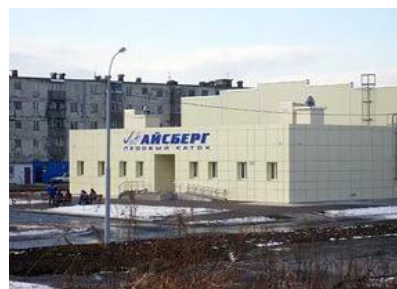
Ледовый дворец «Айсберг»