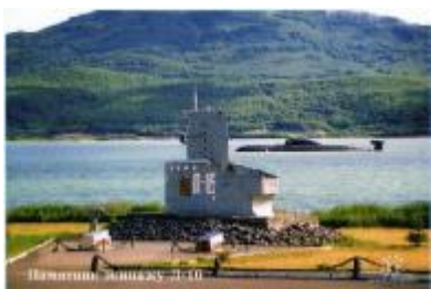
Памятник подводной лодке Л-16

Куда пойти с ребёнком в нашем городе? Таких мест достаточно много, несмотря на то, что город наш не большой.